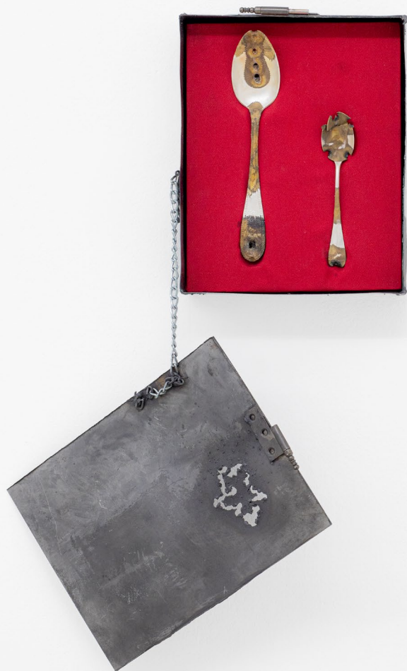
Spoony my sweet. 2024 Casket for Silver spoon.