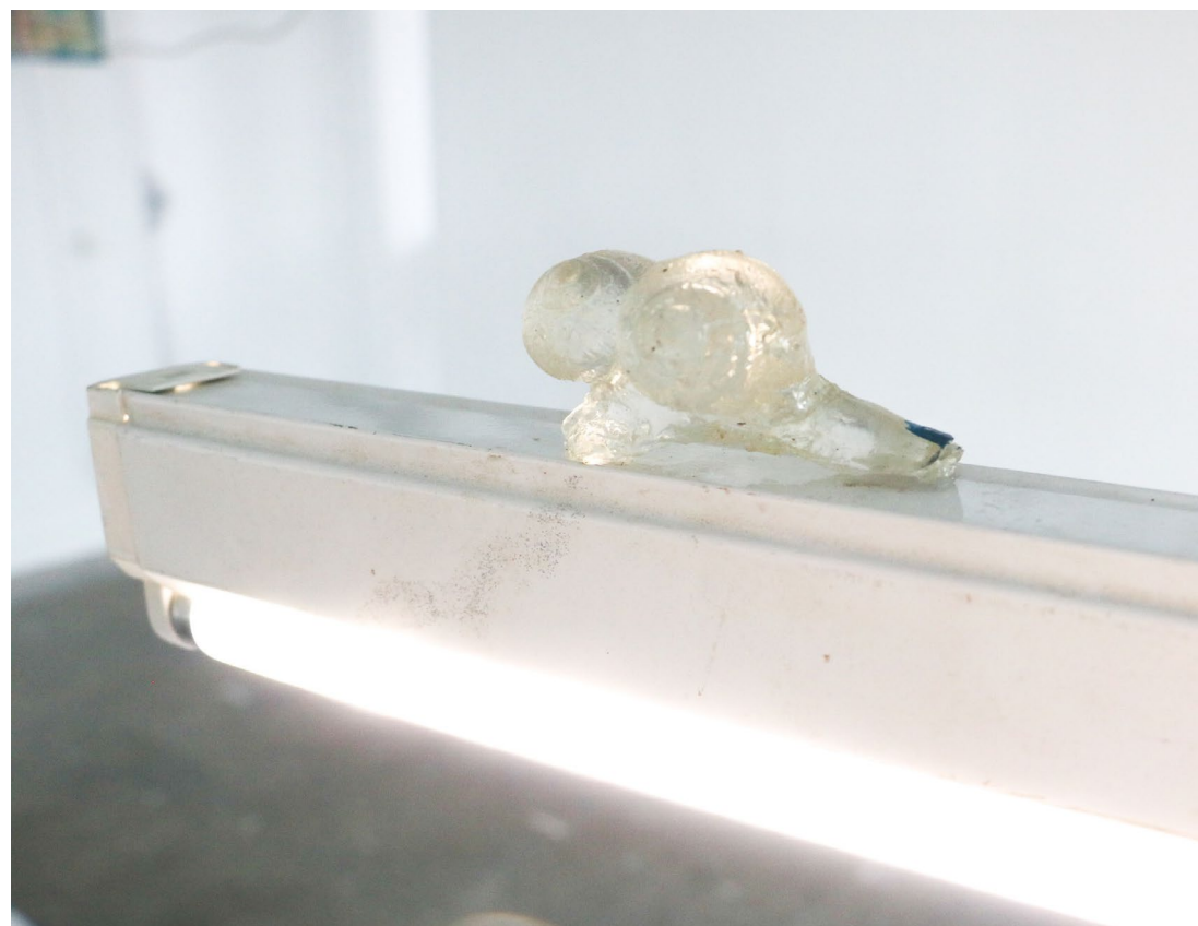
Finger/Snails (parasitant l'installation _Ce qu'il reste après... Wedding residue). 2023.