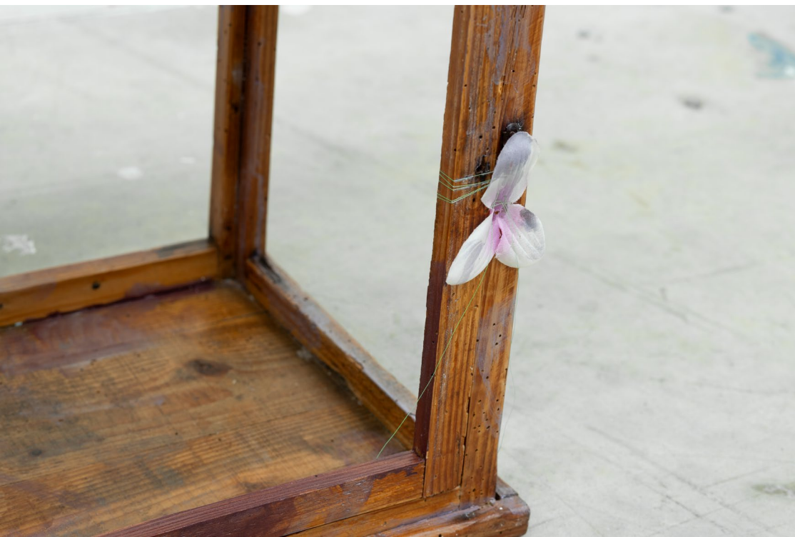
Box Life #1. 2024. Wood case, plastic flowers, oil on wood, Bedside lamp.