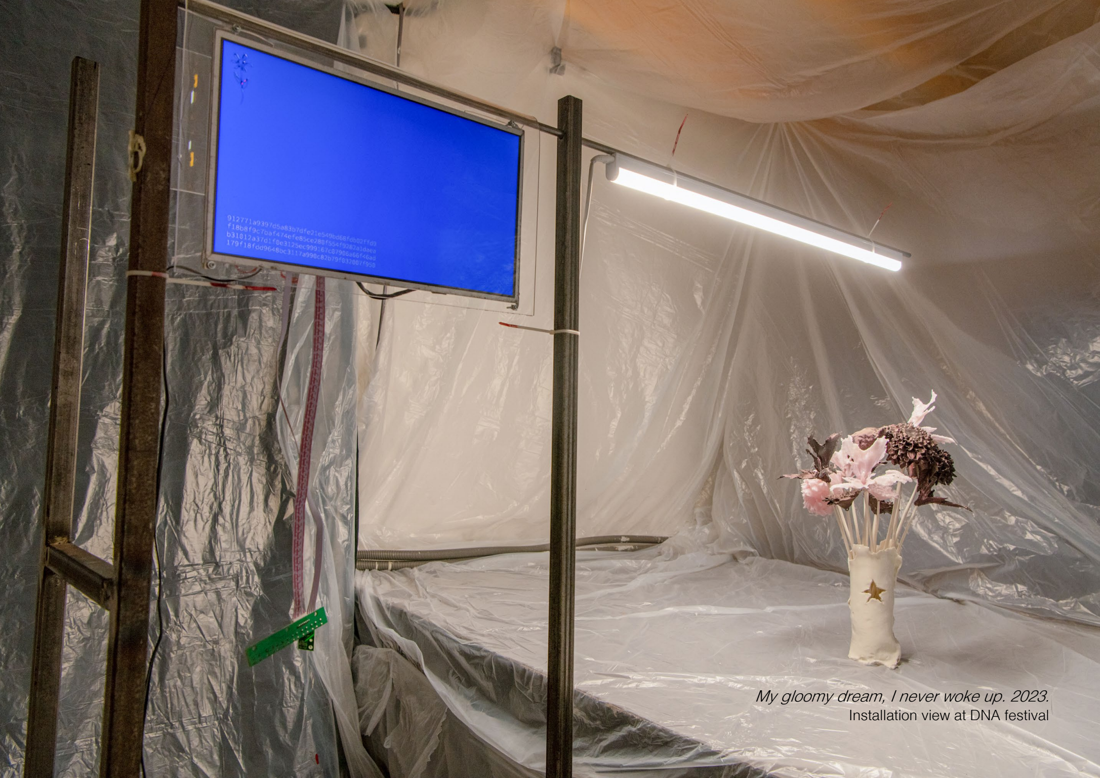
My gloomy dream, I never woke up. 2023. Installation view at DNA festival