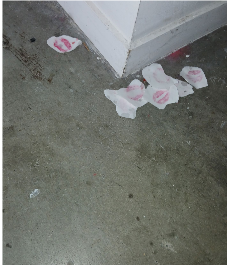
Petits résidus de ton baisé. 2024 Rouge à lèvres on paper.