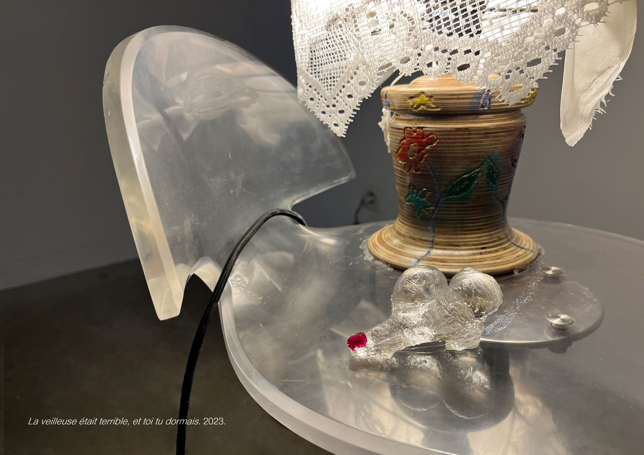
La veilleuse était terrible, et toi tu dormais. 2023.