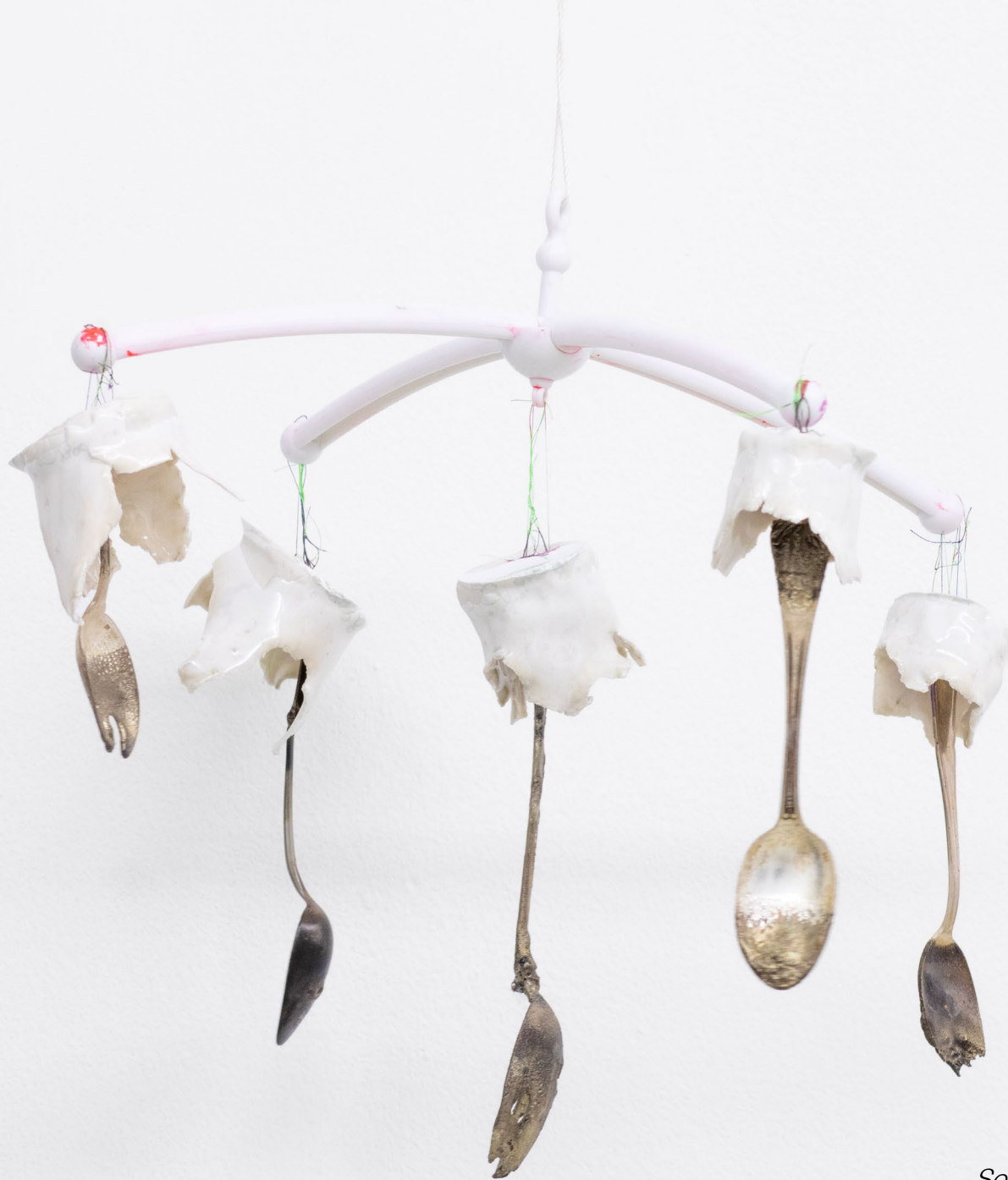
Sometime a star sometime a... . 2023. torn porcelain, silver spoon, remains of mobile, sewing thread.