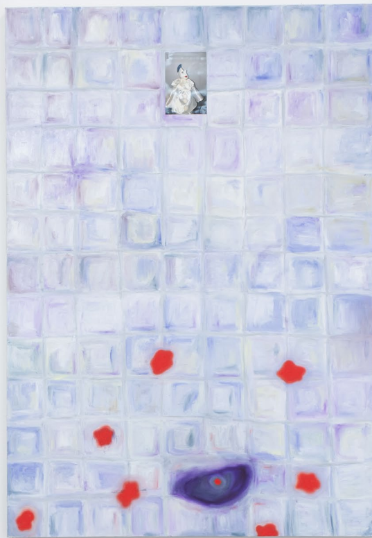
Don't worry it's only shallow/MBV. 2024. (left) Le chant résonnant d'Hardy. 2024. (right) Installation view