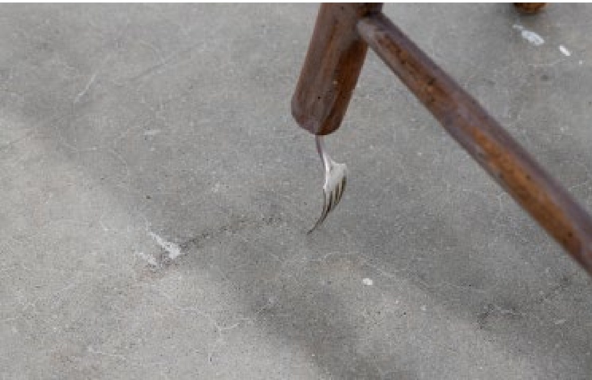
Don't worry it's only shallow/MVB. 2024. Porcelain head, oil on wood chair, feet wood, silver fork, turpentine on clothes.