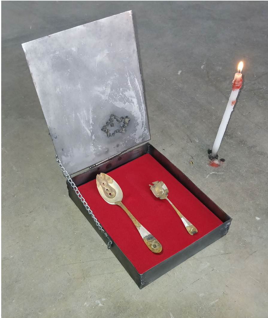
Spoony my sweet. 2024 Casket for Silver spoon.