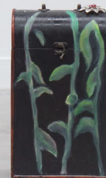
Box life#1 .2024.(left) Box life#2 .2024. (right) Varicella Flower .2024. (up) Installation view