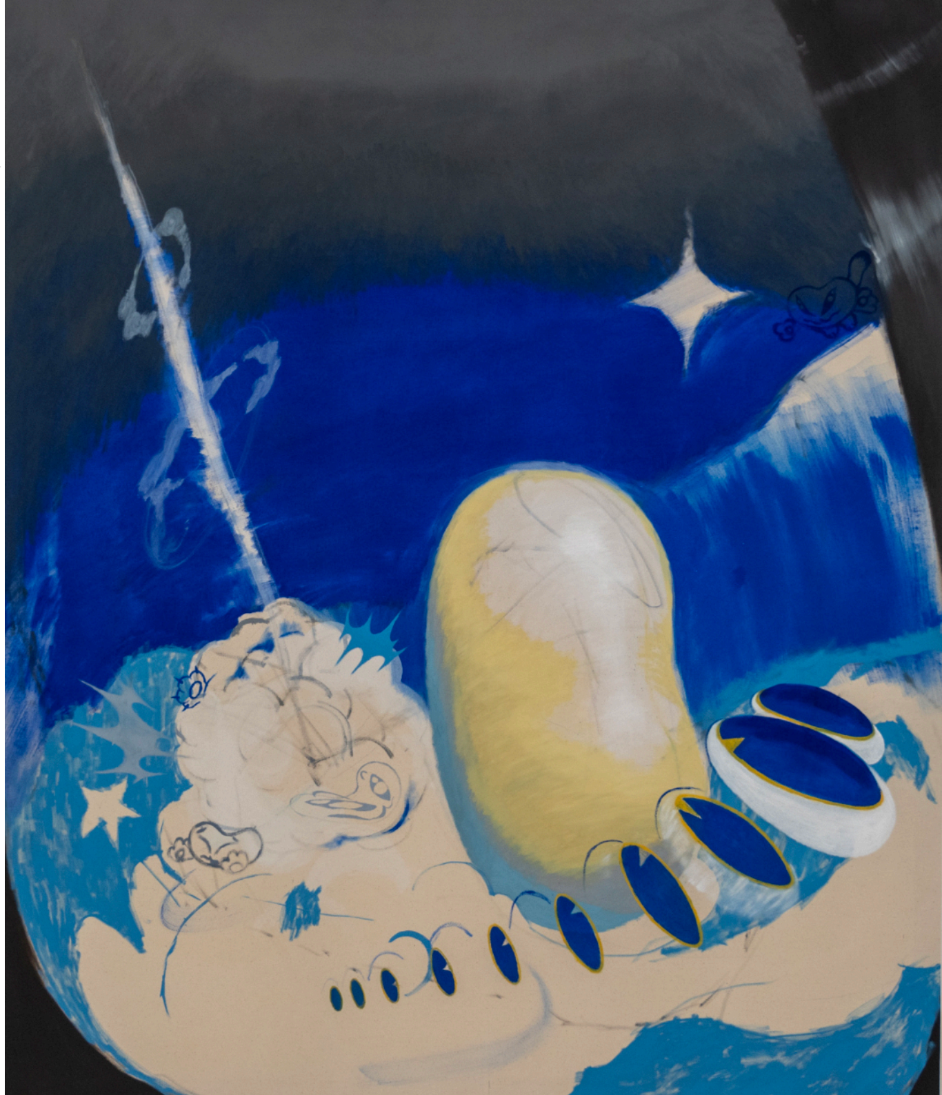
Haricot Tarbais , oil on canvas, 200x170cm, 2025