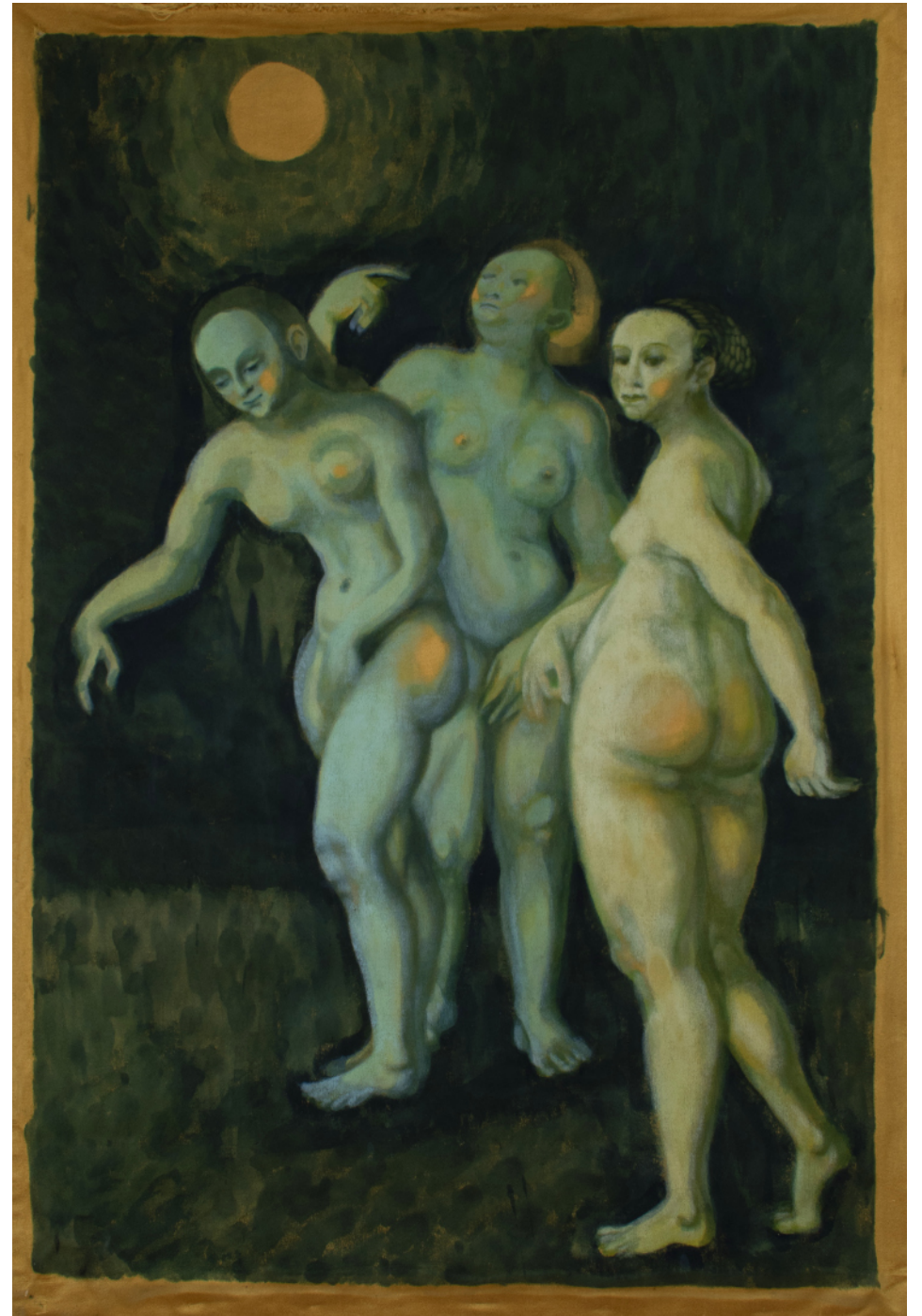
Les Sélénites , 2019, acrylic on velvet, 90x65cm