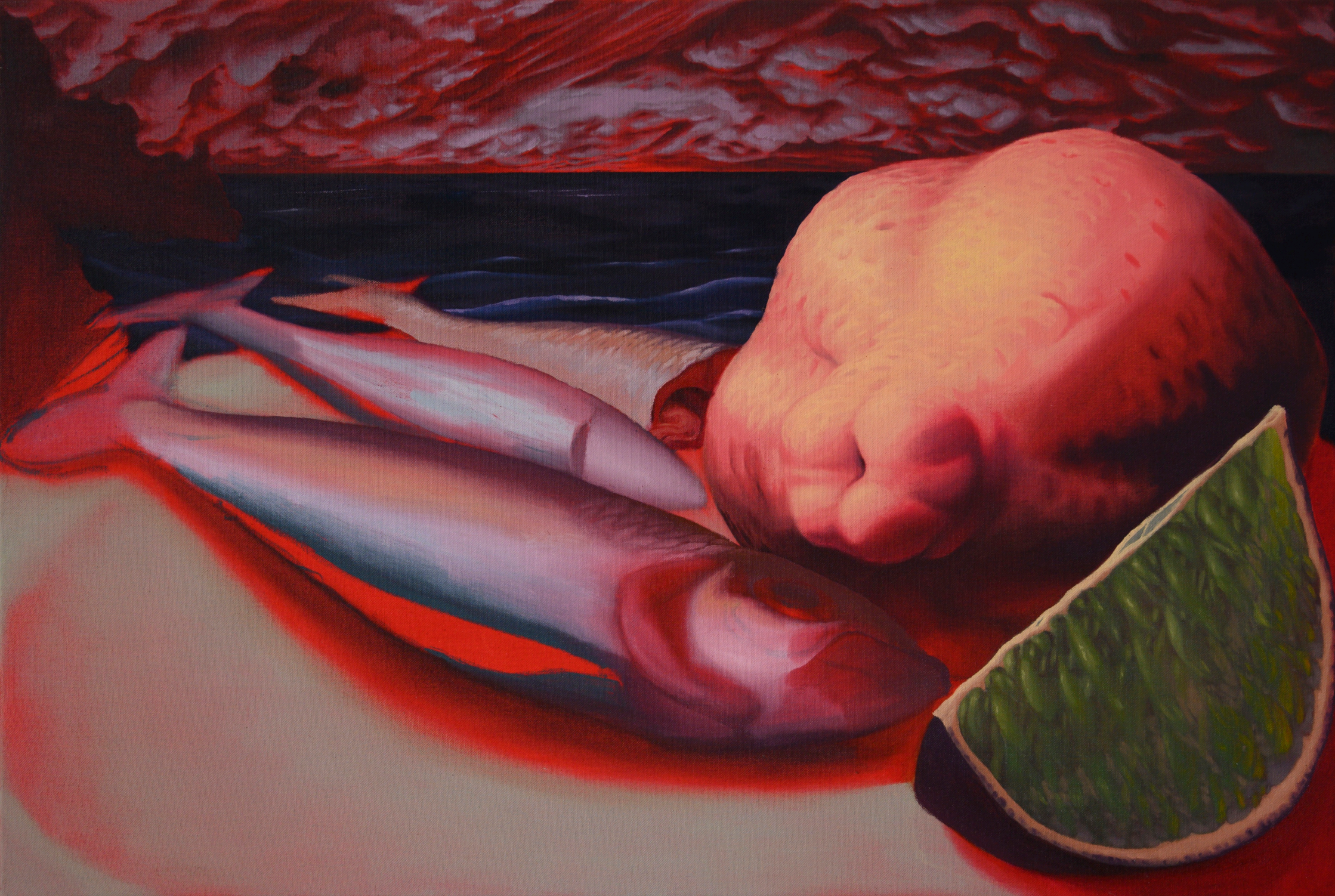
Trois Harengs, deux Citrons, 2023, oil on canvas, 60x80cm