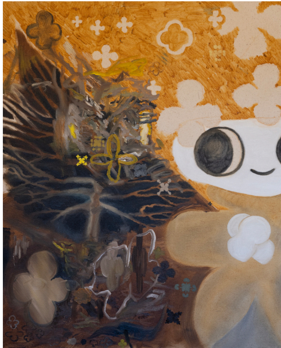
Untitled V, 2024, oil on canvas, 80x65cm