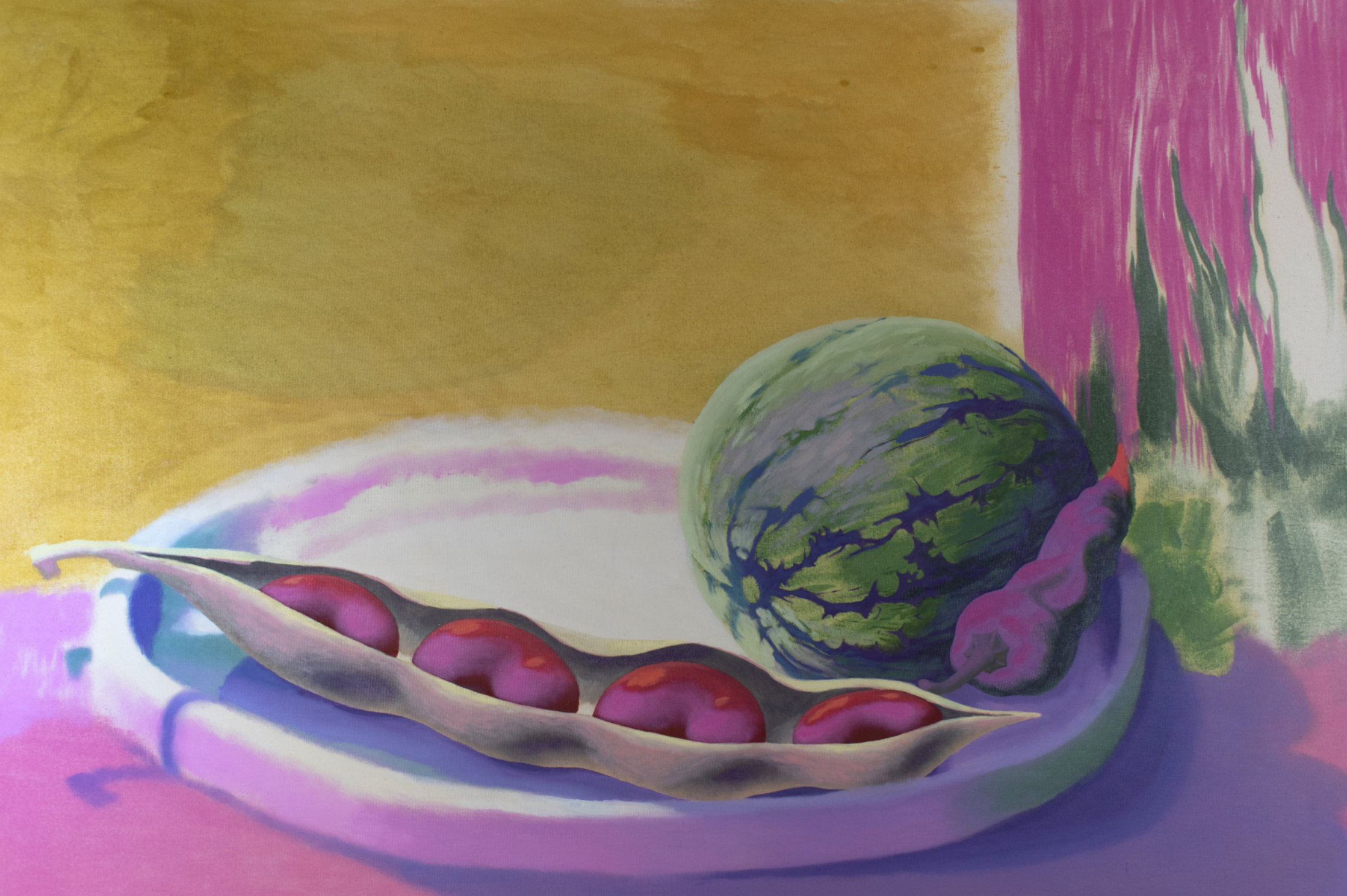
Haricots rouges en été , 2021, oil on canvas, 85x120cm