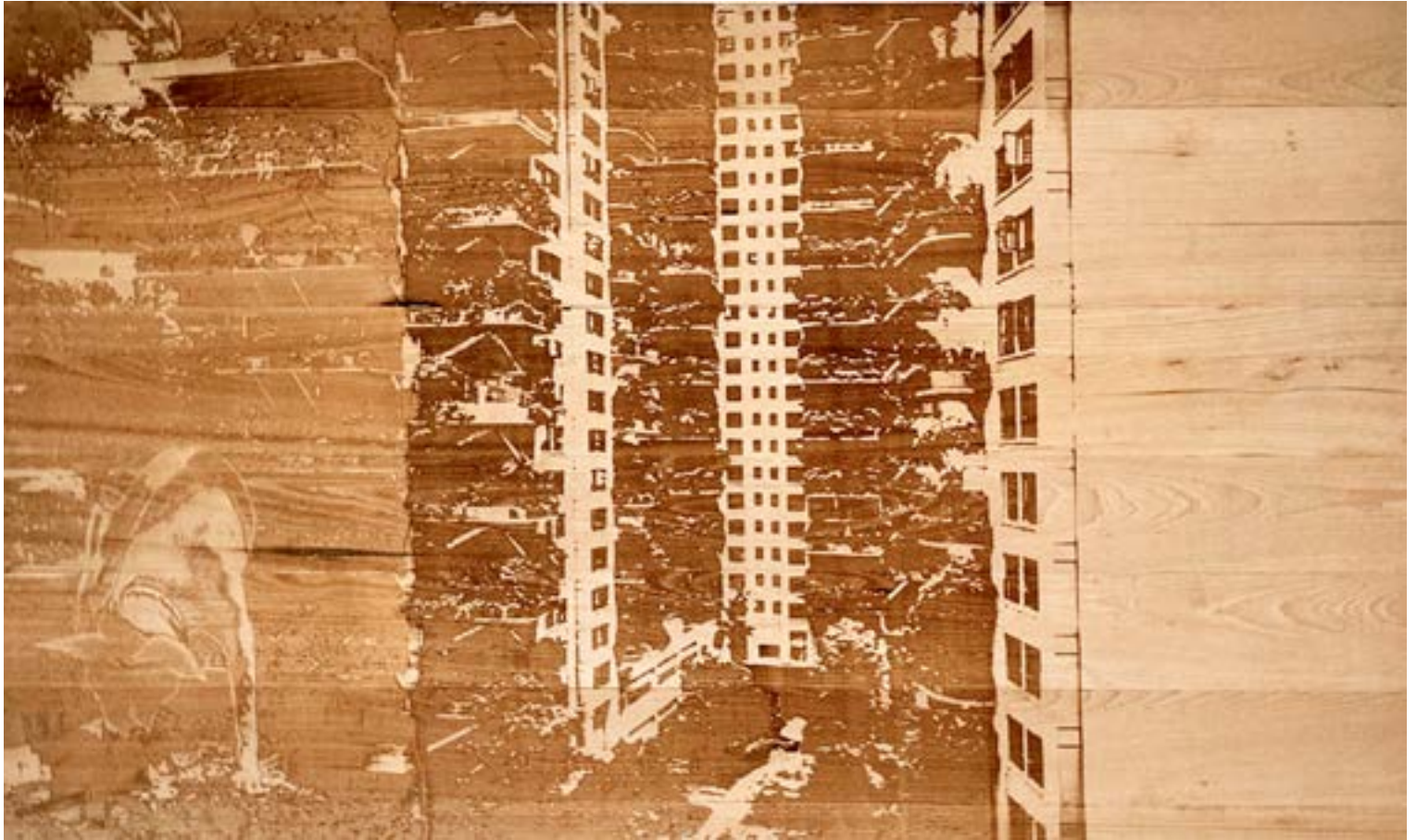
Planche Hêtre manufacturée, impression en relief à la graveuse laser. 1mètre sur 1mètre60. Collage de 2 images. Ville abandonnée (Chengdu) suite à une invasion de moustique & chien domestique. Constat d'une non cohabitation inter-espèces. 2024