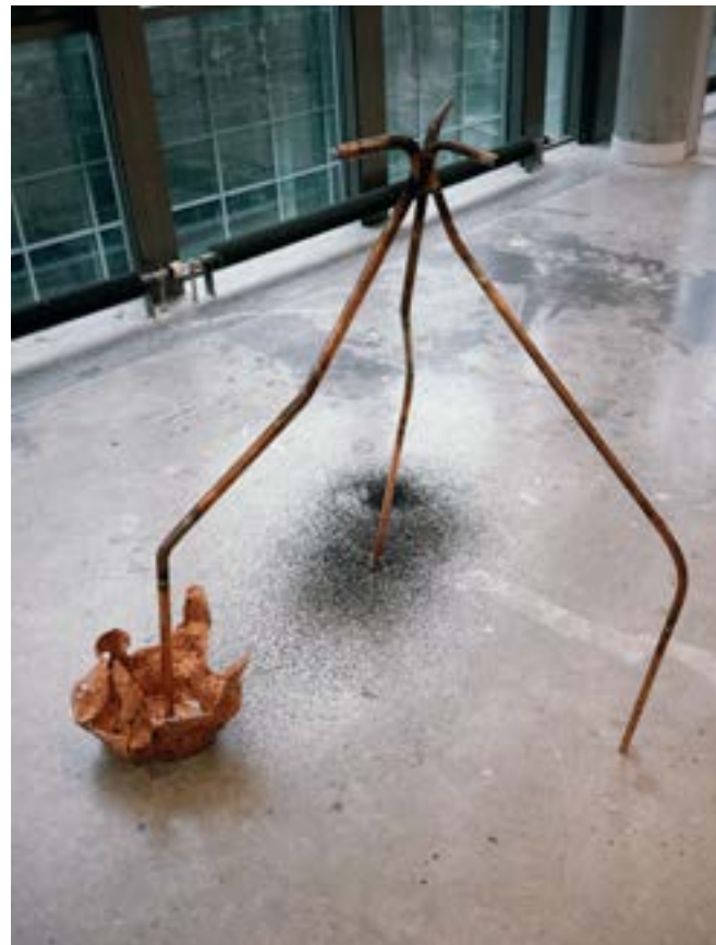
C ramique pi ce florale, cuivre, poils canins. Sable noir