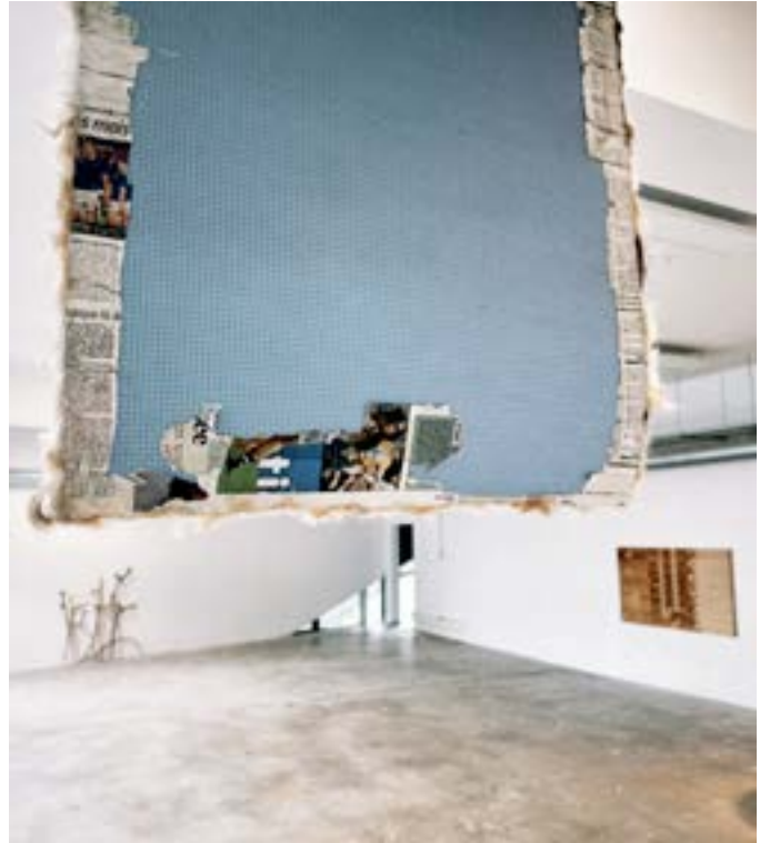
Tapis de Yoga, Poils Canins, Papiers Journaux.