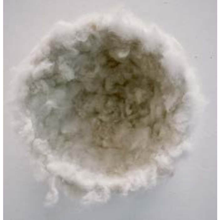
Structure immersive en poils canin.