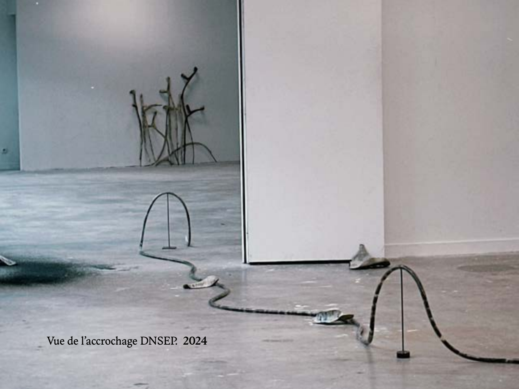
Vue de l'accrochage DNSEP. 2024